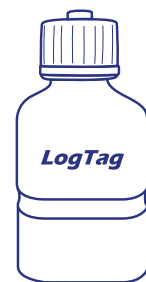
Glykolpuffer Nicht enthalten