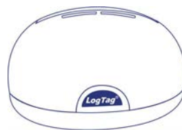
LTI-HID Nicht enthalten